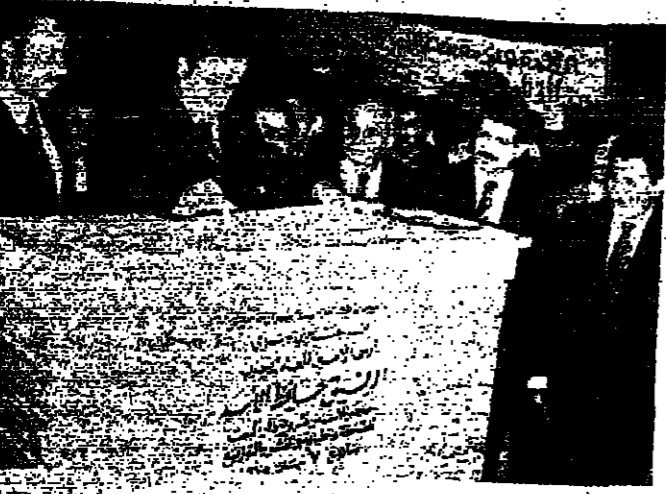
الرئيس الأسد يضع جسر التماسي جسر الأمل في دمشق

شهدت الاحتفالات السورية أمس الأول مهرجاناً خطيبية كبرى احتفاء بالذكرى الثامنة والعشرون لتأسيس حزب البعث، والقيمت فيها كلمات الحزب والجمهورية القومية الشعبية والمنظمات الشعبية، التي أشادت بمسيرة النضال العربي من أجل تحقيق أهداف الأمة العربية في الوحدة والحرية والاشتراكية.